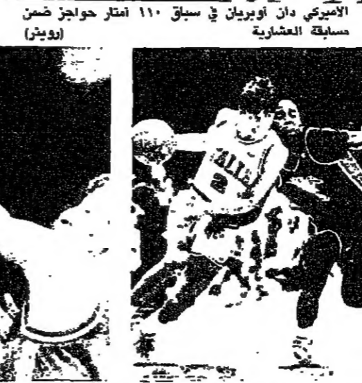
لقطة من مباراة الولايات المتحدة واليابان لكرة السلة (روبيرت)